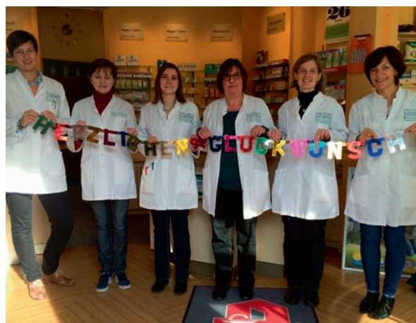
Rechts: das Team der Nord Apotheke gratuliert