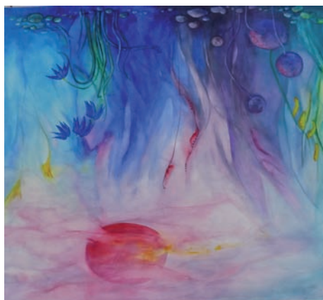
Links: Dietlind Seeburg "Verträumter Garten"