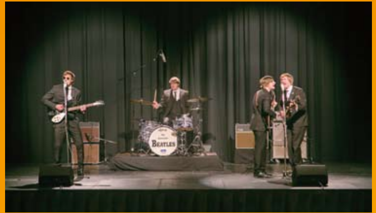
Sonntag, 28.08.2016 18:45 Uhr The Quarryman Beatles